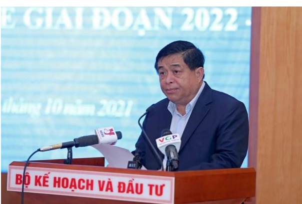
Bộ trưởng Bộ Kế hoạch và Đầu tư ông Nguyễn Chí Dũng phát biểu

Bộ này cũng chỉ ra 8 nhóm nhiệm vụ, giải pháp hỗ trợ phục hồi và phát triển kinh tế trong giai đoạn mới.