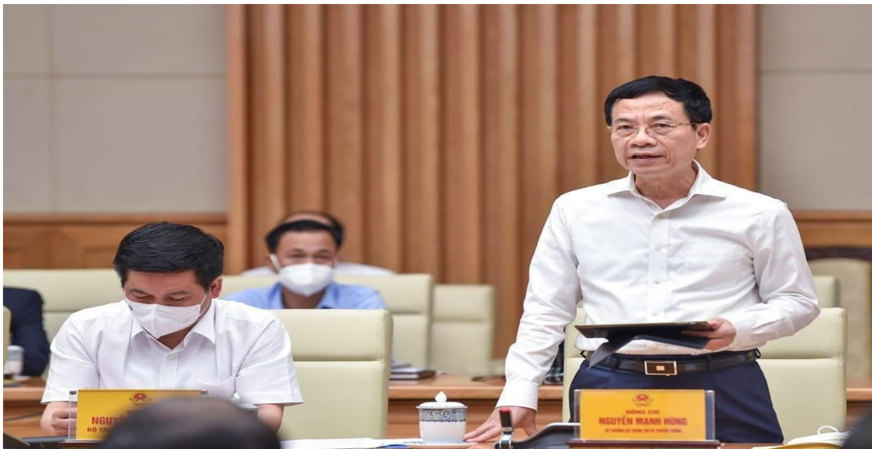
Bộ trưởng Nguyễn Mạnh Hùng phát biểu tại hội nghị của Thủ tướng với cộng đồng doanh nghiệp và các địa phương.