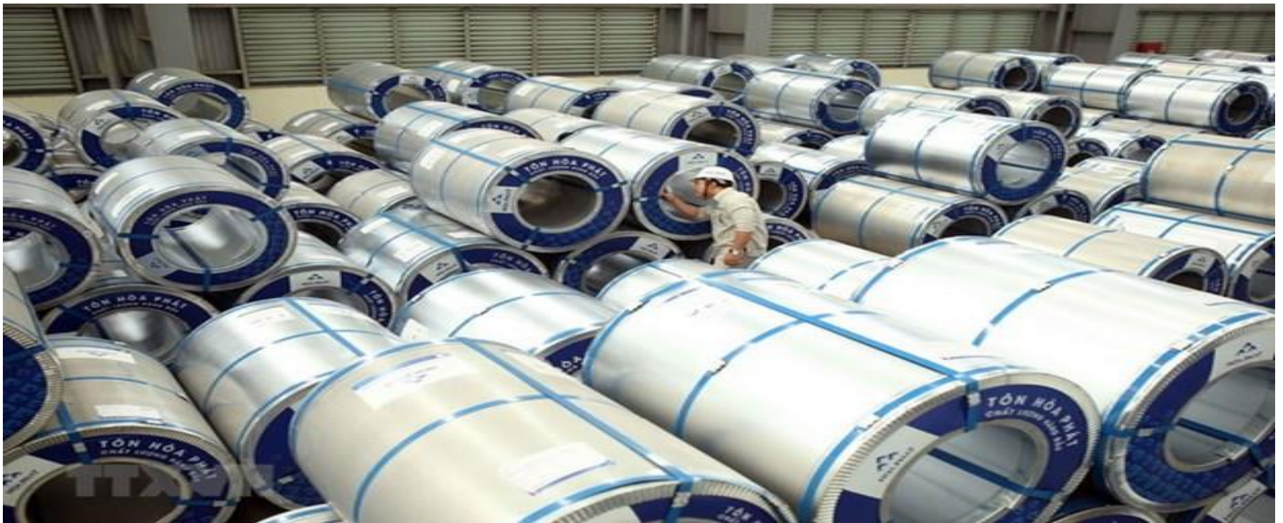
Sản xuất thép cuộn xuất khẩu tại Công ty Cổ phần Tập đoàn Hòa Phát